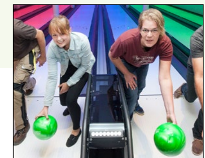
Mit Bowling beschwingt in den Winter